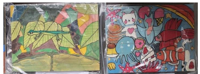
↑ 5年生 系のこすいすい